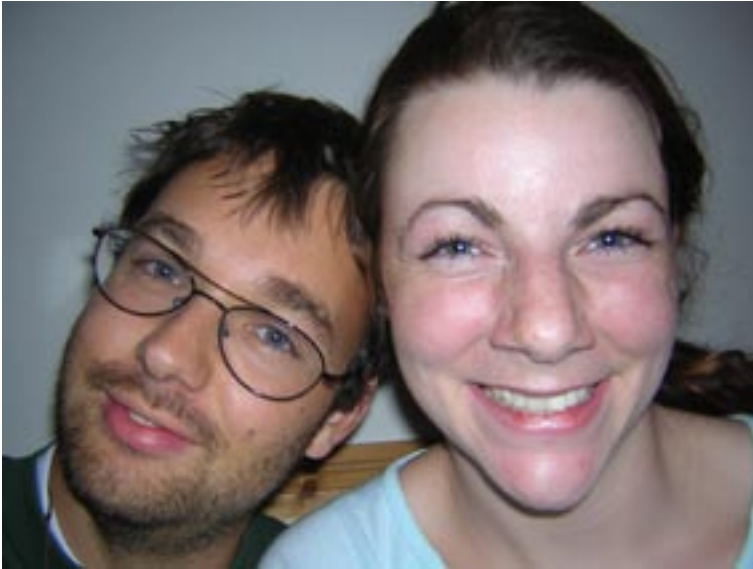
der Zusammenhalt der Begleiter und Begleiterinnen ist sehr groß