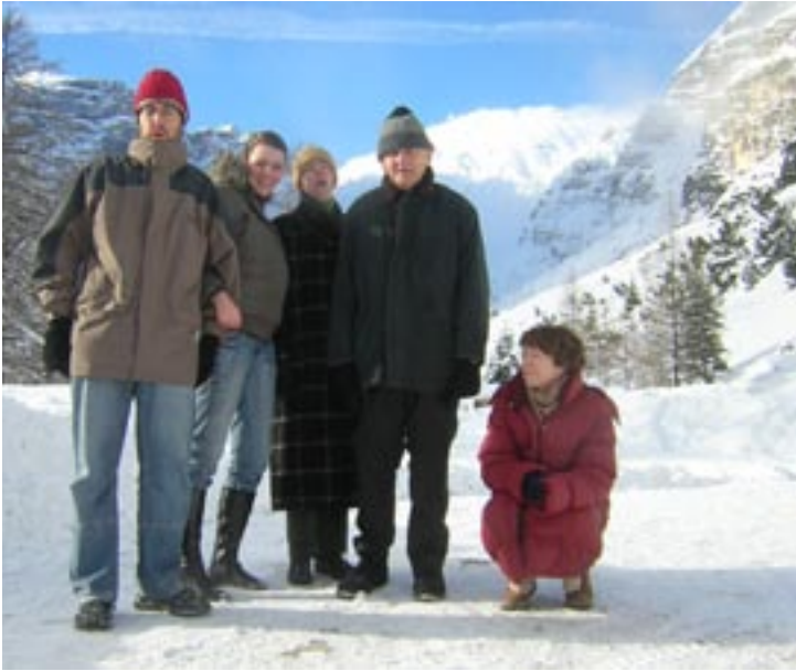
Winterwanderungen in wunderschöner Berg- landschaft bringen allen Entspannung