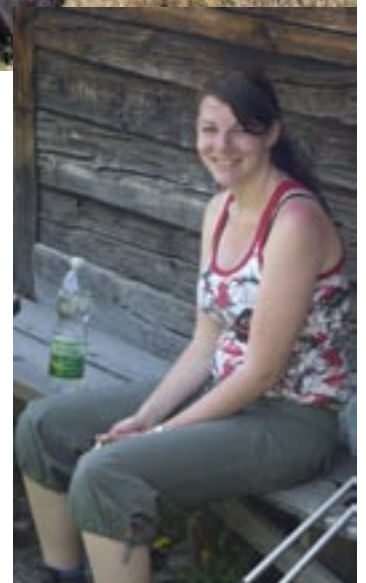
Aber auch in der Freizeit gibt's schöne Ausflugsziele